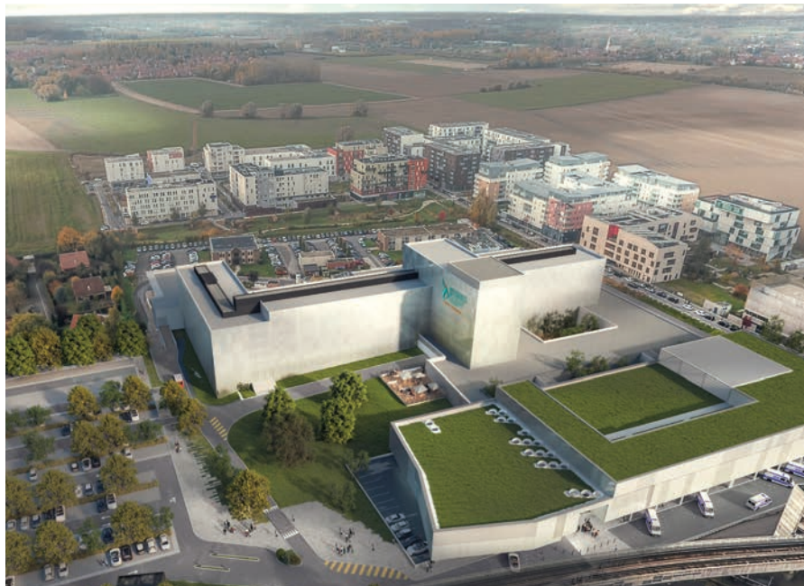
Hôpital Saint-Philibert-Perspective après rénovation

Le service de cardiologie rassemble aujourd'hui près de trente médecins spécialisés en échocardiographie, rythmologie, imagerie... Ils assurent le diagnostic et le traitement de maladies telles que l'insuffisance cardiaque, l'hypertension artérielle, le rétrécissement et la sténose aortiques, les valvulopathies.