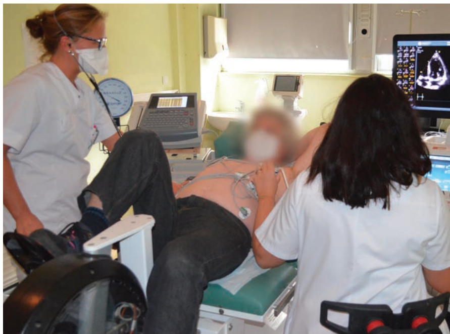
Examen d'échocardiographie au service de cardiologie de l'hôpital Saint-Philibert